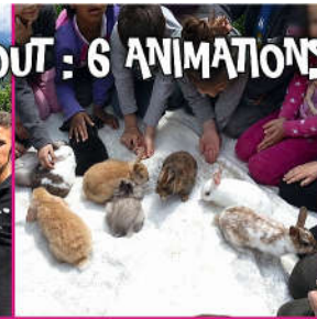
16 h : câlins aux lapins