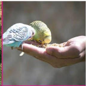
18 h : nourrissage des perruches

DU 01 JUILLET AU 30 AOUT : 6 ANIMATIONS PAR JOUR