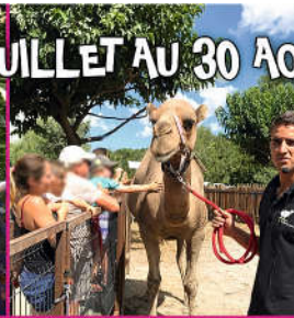
15 h : découverte des camélidés