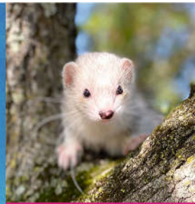
11 h 30 : découverte des furets