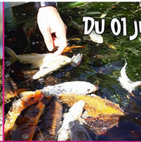
14 h : caresses aux carpes koi