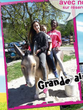
Grande aire de Jeux

Parc ouvert chaque année d'avril à novembre. Fermé en cas de grosse pluie.