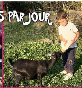
17 h : biberons des chevreaux/agneaux